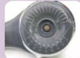
Douchette à Buse centrale