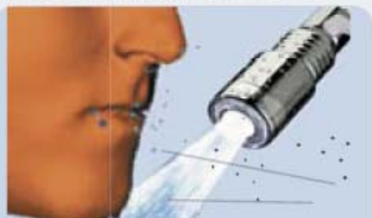
Exemple de nébulisation par adjonction d'air

Ces Aérosols deviennent à risques* (taille de 0,5 à 8 um) dans le cas d'une contamination du réseau, du type Légionnelle et dans ce cas ces derniers véhiculent les bactéries jusqu'au poumon de celui qui prend sa douche.