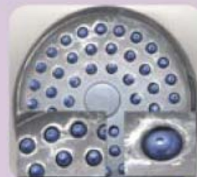
Douchette à Picots