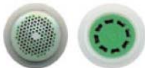
Régulation par Joint Torique