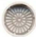
Coque Lisse HOSTAFORM®

La régulation de débit est effectuée grâce à la présence d'un joint torique à système compensé, 5 débits au choix : 12, 10, 8, 6, 4,5 litres/minute.