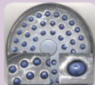
Douchette à Picots