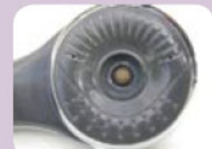
Douchette à Buse centrale