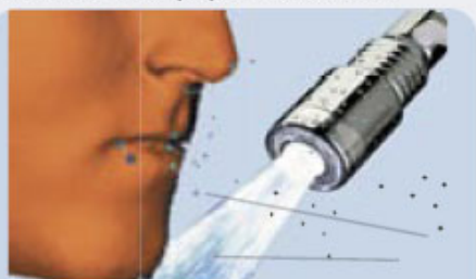
Exemple de nébulisation par adjonction d'air

Ces Aérosols deviennent à risques* (taille de 0,5 à 8 um) dans le cas d'une contamination du réseau, du type Légionnelle et dans ce cas ces derniers véhiculent les bactéries jusqu'au poumon de celui qui prend sa douche.