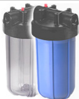
Portes-Filtres Big-Blue® - 10"

L a filtration peut se réaliser à l'aide de Portes-Filtres à cartouches. Pour correctement prendre en charge toute l'eau d'adduction d'un l'habitat, il faut privilégier ici des Portes-Filtres "larges" de type Big-Blue® acceptant des cartouches de 12 cm de diamètre (4,5 pouces) : Cette solution bien dimensionnée permet d'allonger le cycle de remplacement des cartouches , qui devient quasi-annuel dans la majorité des cas ... La maintenance des cartouches filtrantes est ainsi moins fastidieuse qu'avec les petits systèmes filtrants "standards", acceptant des cartouches de seulement 5 cm de diamètre (... la durée de vie des cartouches avec ces petits filtres est souvent de moins de 3 mois ! ).