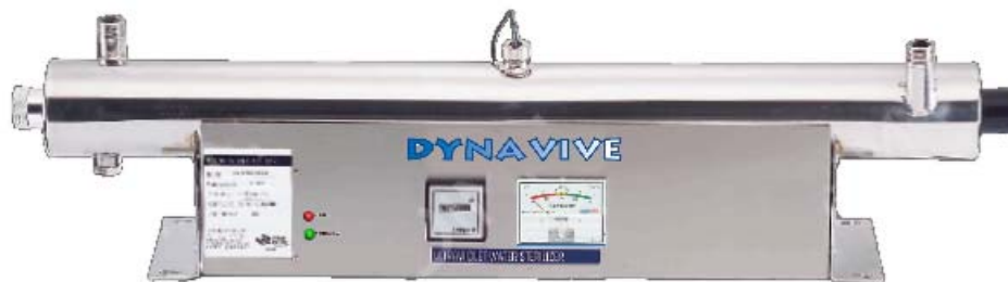
Stérilisateur-UV 40 Watts avec Capteur Sensor et Moniteur d'intensité de la lampe

Pour un habitat individuel de petite taille, un Stérilisateur d'une puissance de 20 Watts peut être suffisant pour désinfecter une eau très faiblement contaminée. Cependant, une puissance de 40 Watts est souvent mieux adaptée pour bien prendre en compte une bactériologie toujours fluctuante dans les eaux de nappe et garantir une eau de qualité sans risques sanitaires en toutes circonstances.