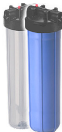
Portes-Filtres Big-Blue® - 20"